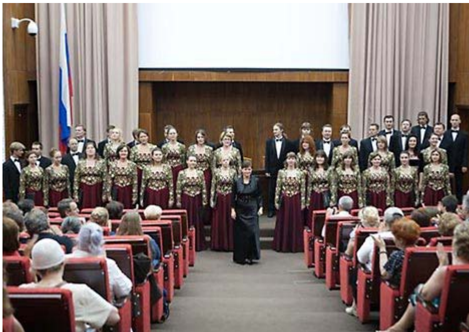
Eröffnungszereemonie mit musikalischer Umrahmung