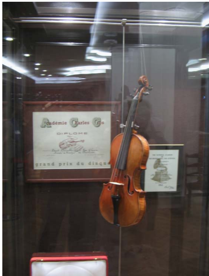
Eine Geige von Stradivari im Glinka-Museum