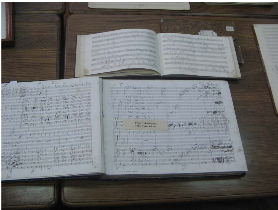
Das „Nussknacker“-Manuskript von Tschaiowsky in der Bibliothek des Glinka-Museums