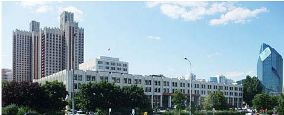
Das Tagungsgebäude in Moskau

Die diesjährige IAML-Tagung wurde von der russischen IAML-Ländergruppe ausgerichtet und fand im Gebäude der Staatsdienstakademie des Präsidenten der Russischen Föderation in Moskau statt. Die IAML-Tagung wurde von 250 Teilnehmern besucht, davon 118 aus Russland und 23 aus Deutschland. Obwohl fast die Hälfte der angemeldeten Teilnehmer aus Russland kamen, waren sie während der Tagung kaum präsent. Nur bei den Vorträgen in russischer Sprache (die simultan ins Englische übersetzt wurden) waren mehrere russische Teilnehmer anwesend. Anscheinend sind englische Sprachkenntnisse in Russland noch nicht sehr weit verbreitet.